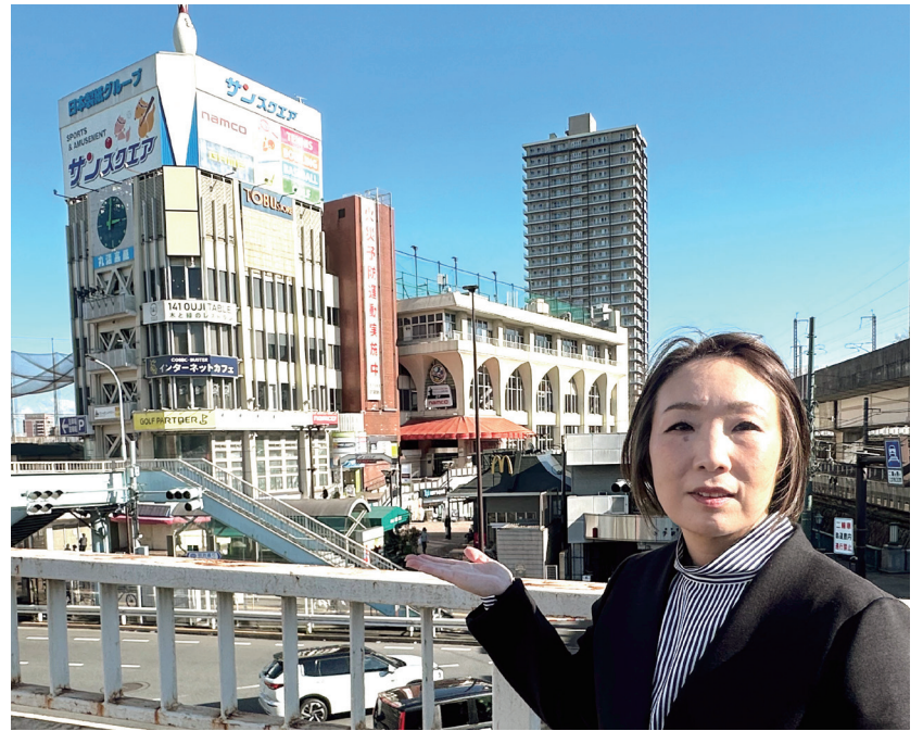
この場所に、190メートル、50階のツインタワーが出現するのか？

王子駅周辺まちづくりの再開発計画が進んでいます。 幼い頃より、北区で生まれ育った私の一番身近な繁華街は王子。今はなくなってしまった王子シネマで映画を観たり、友達とサンスクエアのスケート場やボウリング場で遊んだり、食事をしたり…。楽しかった思い出がたくさんあります。 緑豊かな桜の名所、飛鳥山。その脇を走る都電は今でも昭和の名残を残す、下町北区が誇る風景です。庶民の台所として賑わった東武ストア、歴史のある柳小路商店街なども、地元住民に親しまれてきました。 一方で王子駅周辺地域には、水害対策や複雑な動線の解消、歩行者空間の整備などの課題もあります。今回の再開発計画が、仮にこうした課題の解決に向けた一歩になるとしても、高さ190メートル、50階のツインタワーという威圧的な超高層建築は、誰が見ても王子に似つかわしくないことは明らかではないでしょうか。 王子のまちに必要なものはなにか？ 住民の声を聞き、そこに暮らす人たちが安全・安心に住み続けられるまちづくりを、住民とともに考え示していくことが、今こそ北区に求められています。